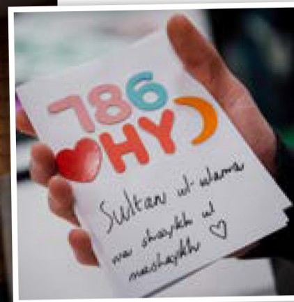
FANZINE. Hinduism och filosofi samsas i detta verk.